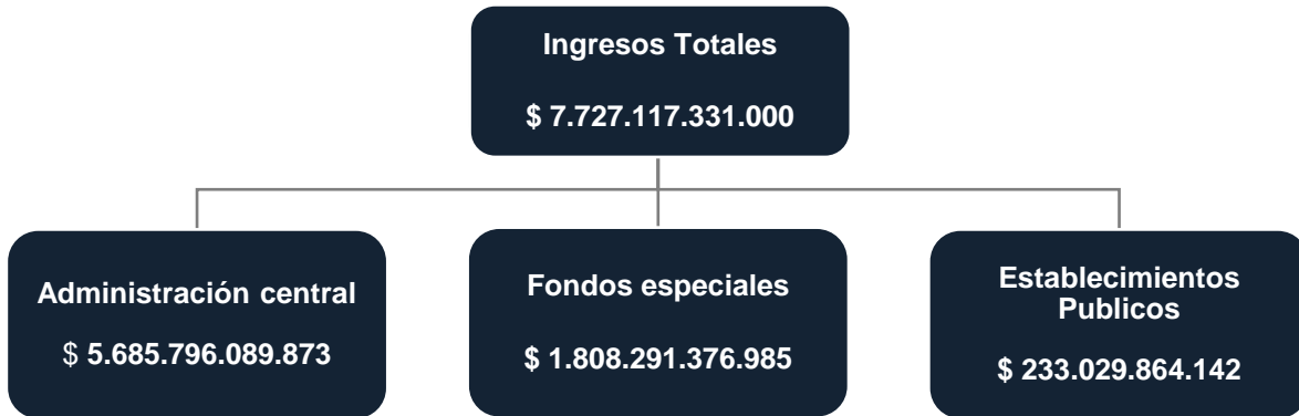
Tabla 9. Ingresos de la administración central