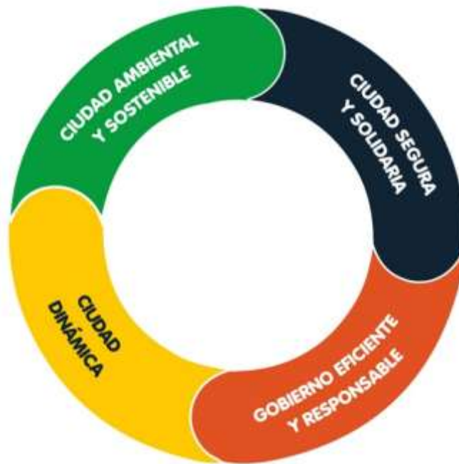
Diagrama 4. Articulación de líneas estratégicas del Plan de Desarrollo Territorial 2024 – 2027 “Barranquilla a Otro Nivel”